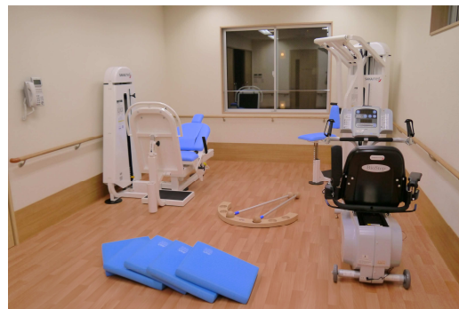
(トレーニングルーム)