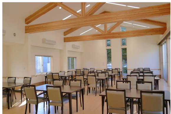
(ダイニング兼デイルームスペース)

この件に関するお問い合わせ先： 株式会社 JALUX トラスト TEL：03-5799-6021