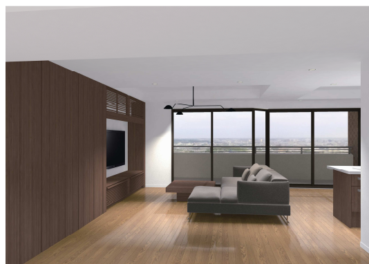
(リビング完成イメージ)

この件に関するお問い合わせ先: 西日本支社 航空・サービス事業部 TEL:06-6643-0262