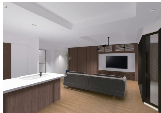
(リビング完成イメージ)