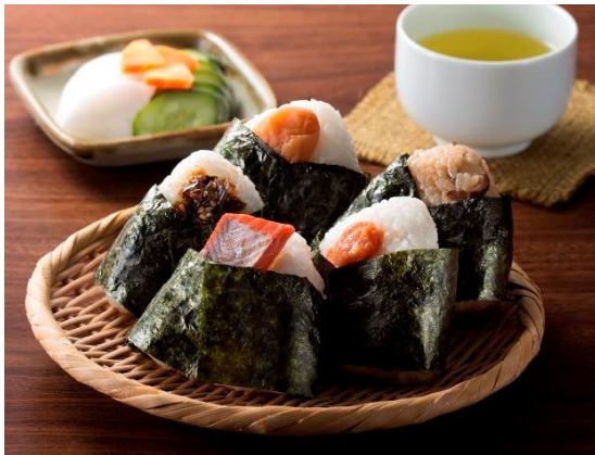
おにぎり（イメージ）

株式会社 JALUX（所在地：東京都港区、代表取締役社長：高濱 悟、以下「JALUX」）と株式会社カネカ（本社：東京都港区、社長：田中 稔、以下「カネカ」）は、 カネカ生分解性バイオポリマー「Green Planet ® 」 （以下 Green Planet）製の食品フィルム包材を、JAL 羽田空港ダイヤモンド・プレミアラウンジで提供されるおにぎりの包材に採用します。食品の個包装に Green Planet 製フィルムを用いる事例としては世界初 *1 となります。