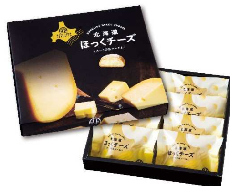
北海道ほっくチーズ

この件に関するお問い合わせ先 株式会社 JALUX 事業企画室 空港リテール課 TEL:03-5756-9110