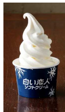
白い恋人ソフトクリーム