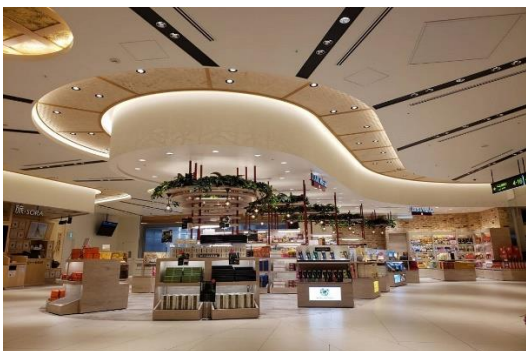
「ITAMI Marché BLUE SKY」