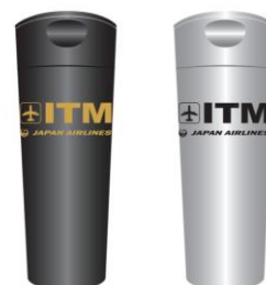
「スライドサーモタンブラー」

TABITUS+は、出張や旅行に“心地よさ”をプラスするトラベルファッションのセレクトショップです。広い空間に、オリジナルトラベルファッションブランド「TABITUS」商品をはじめ、バッグ類やトラベル雑貨、JAL オリジナルグッズなど多数の商品を取り揃えています。本店舗は関西初となる常設店舗で、空港内の店舗としては、羽田空港 BLUE SKY FLIGHT SHOP、福岡空港 TABITUS+に続き3店舗目となります。