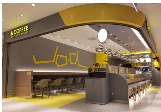
「&COFFEE MAISON KAYSER」