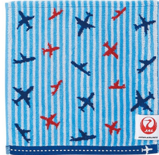
[JAL オリジナル] ミニタオル ポーチ付き エアトラベル