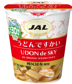
JAL SELECTION うどんですかい など