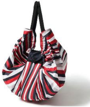
[マーナ xJAL ショッピング]Shupatto コンパクトバッグ M JAL 客室乗務員スカーフ柄