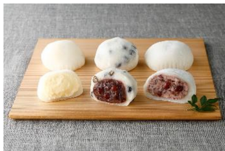
トカチカラ 十勝大福3種アソート