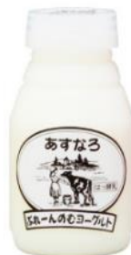
あすなる ぶれーんのもよーグルト