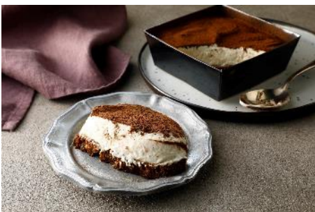
トカチカラ 十勝ティラミスケーキ

北海道 十勝発、素材の魅力を存分に引き出した、新たな和・洋スイーツ「トカチカラ」が大宮駅に初登場します。十勝の大地からいただいた「自然の恵み＝力(ちから)」を、感謝の気持ちと情熱で魅力あふれる食に仕立てて、「from 十勝＝十勝から」お届けする、という意味が込められた、新たなスイーツブランドです。