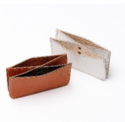
JALオリジナル ボーイング777 カーゴライニング カードケース ホワイト/ブラウン