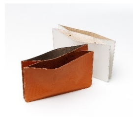
JALオリジナル ボーイング777 カーゴライニング PCケース ホワイト/ブラウン

JALボーイング777型機のカーゴライニング(貨物室の壁紙)を用い、カリモク家具の商品でも使われている良質な革を用いて製作したカードケースとPCケース。プロダクトデザイナー 熊野亘氏によるデザイン。