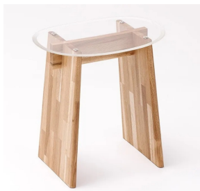
JALオリジナル ボーイング777 キャビンウィンドウ スツール